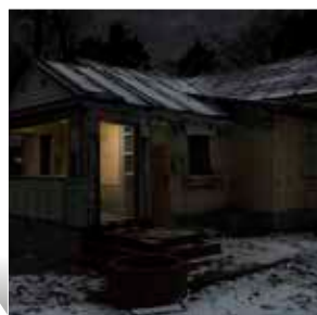
Yves LACROIX À travers les fissures en nous la lumière pénètre