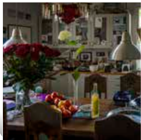
Luisa FERREIRA Intimidade

Tous les jours (sauf les mardis) 10h-12h30 et 13h30-17h